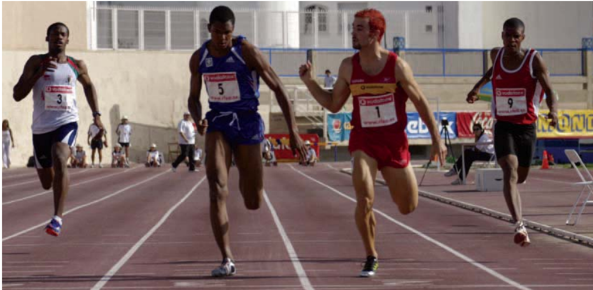
La competición fue un duelo entre España y Francia que se resolvió en las últimas pruebas