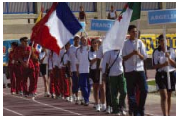
Argelia, Francia España y Túnez participaron en el Encuentro

España se adjudicó el Encuentro tanto en la modalidad masculina como en la femenina