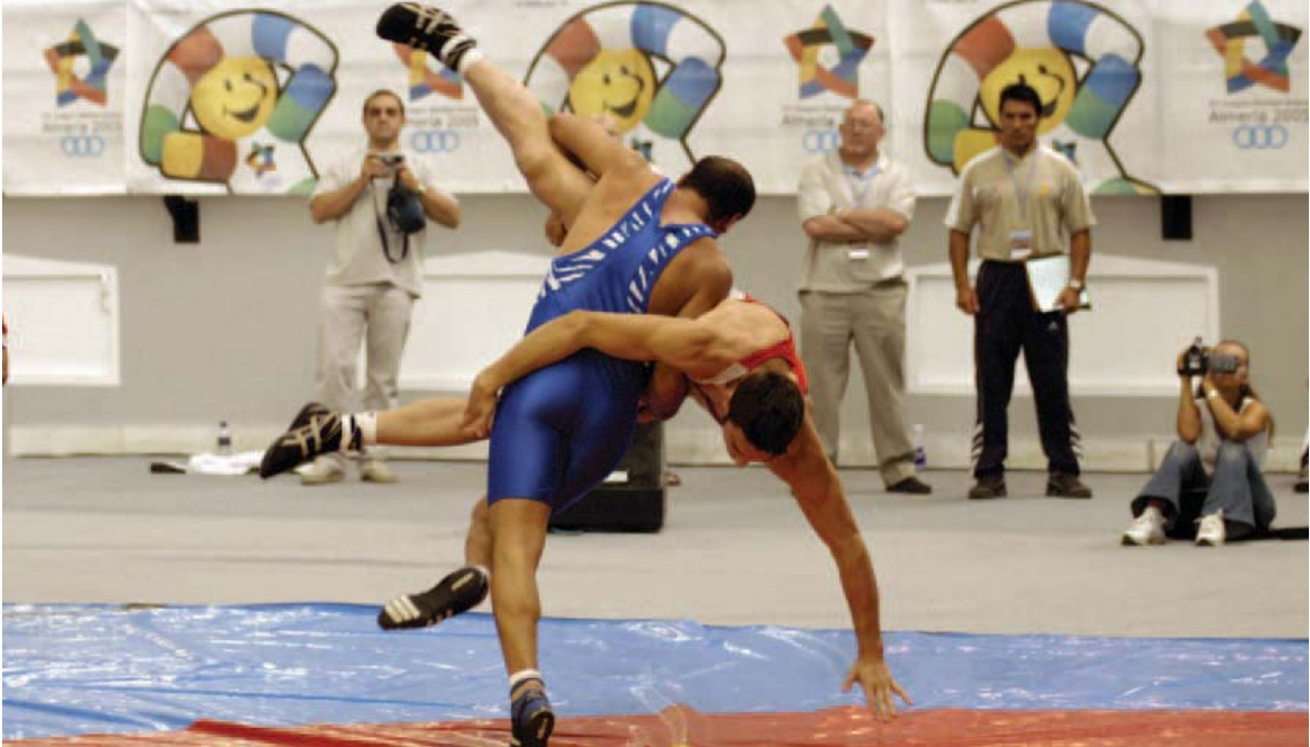
La competición fue espectacular